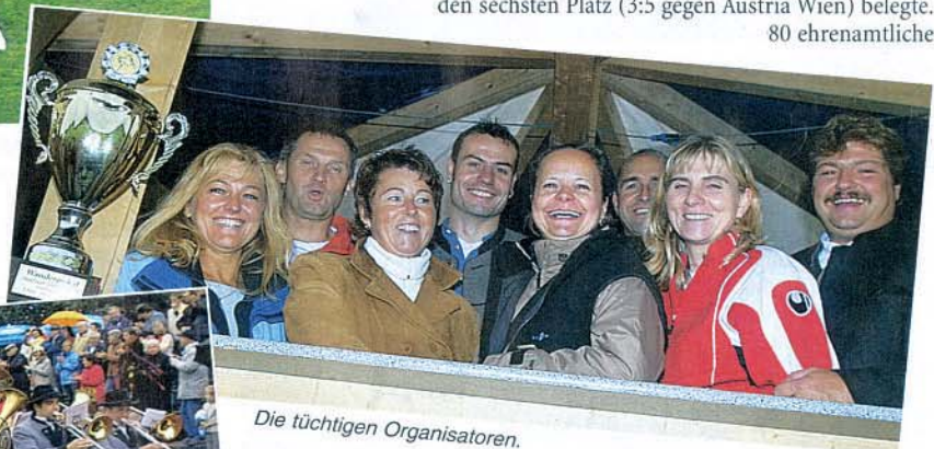
Die tüchtigen Organisatoren.