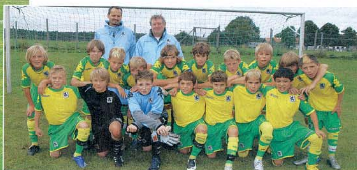
Die siegreichen Jung-Löwen.

den DFB-Stützpunkt Holzkirchen besucht, ehe er vom TSV 1860 aus Miesbach nach München geholt wurde. Die Auswahl des Stützpunktes sorgte ihrerseits für die große Überraschung: Unter Trainer Marinus Thurnhuber belegten die Burschen sensationell den dritten Rang (1:0 gegen FC Augsburg).