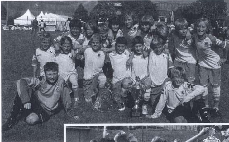
Der Sieger: TSV 1860 München