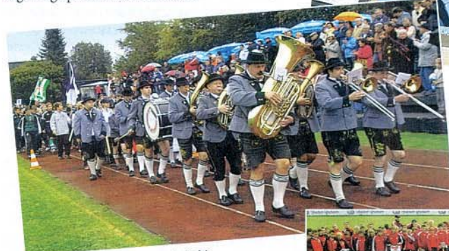
Bayerische Klänge zum Auftakt.

Beim 6. internationalen Challenge-Cup des TSV Otterfing präsentierten 16 D-Juniorenteams aus der Schweiz, Österreich und Deutschland zwei Tage lang Spitzenniveau im Nach-