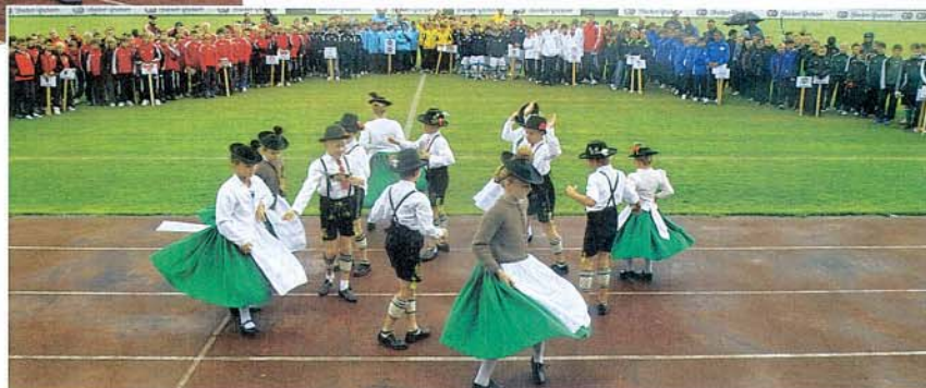
Mit bayerischem Charme wurde der Challenge-Cup eröffnet.