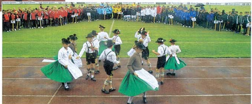
Mit bayerischem Charme wurde der Challenge-Cup eröffnet.