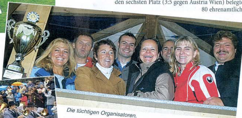
Die tüchtigen Organisatoren.