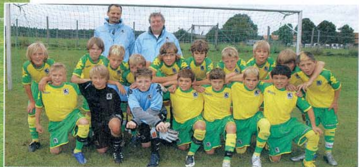
Die siegreichen Jung-Löwen.

den DFB-Stützpunkt Holzkirchen besucht, ehe er vom TSV 1860 aus Miesbach nach München geholt wurde. Die Auswahl des Stützpunktes sorgte ihrerseits für die große Überraschung: Unter Trainer Marinus Thurnhuber belegten die Burschen sensationell den dritten Rang (1:0 gegen FC Augsburg).