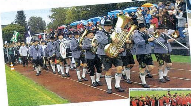
Bayerische Klänge zum Auftakt.